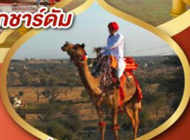
ฟรี ขี่อูฐ เมืองมันทอวา ราคาเริ่มต้น