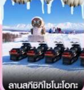
ลานสกีซึกิไซโนะโอะกะ