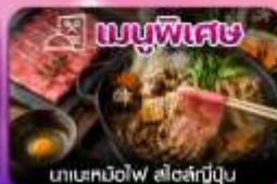
นาเนะฮอนโงะ สาคูญี่ปุ่น

ชิบิบิโร-อาสาฮิกว่า-ลานสกีซึกิไซ-คลองโอตารุ-โรงงานช็อกโกแลต-หมู่บ้านเทพนิยาย-ซ้อปิ้งทานุกิโคอิ-อีสะะเต็มวัน