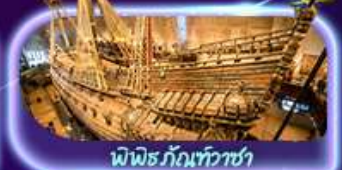
พิพิธภัณฑ์ทิวาซา