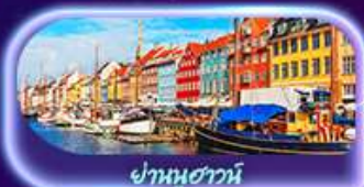
ย่านนูฮาวน์

ชมความงามสโตนอร์คสุดมหัศจรรย์ สถาปัตยกรรม โบสถ์กัมเพลยงคิโอ อาสนวิหารออสเพนสกี อนุสาวรีย์ซิมบลิส พักพิศมณที่ปราสาทคริสตียานเฮลซิงกิ เยี่ยมชมพิพิธภัณฑ์ทิวาซา ศาลาว่าการสตอกโฮล์ม ย่านเมืองเก่า Gamla Stan ถ่ายภาพ Oslo Opera House สวนมนุษย์ชาติ Vigeland ป้อมปราการอาครัสฮูส มหาวิหารออสโล เซ็นทรัลแลนด์มาร์คน้ำพุเทพีออน รูปปั้นนางเงือก พระราชวังมาเลียบนอร์ค พระราชวังคริสเตียนบอร์ก ย่านคิงส์ย่านนูฮาวน์ ซ้อมเบียร์เฮลเลนมาตี ถนนคนเดิน Strøget