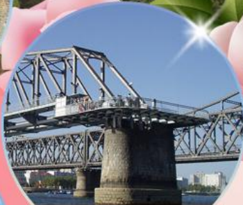
สะพานขาดตานตง