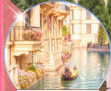
เวนิส เมืองต้าเหลียน