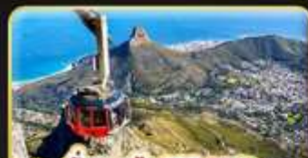
นั่งกระเช้า 360 องศา สู่ Table Mountain