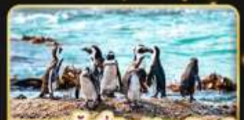
ชมแพนกวิน ที่ Boulders Beach