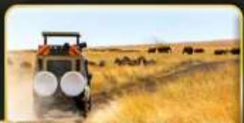
กิจกรรม Safari One Game Drive ชม BIG 5

จุดเริ่มต้นแห่งชีวิต และการเริ่มต้นสำรวจโลก