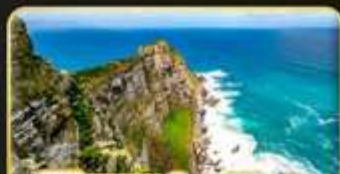
พิชิตแหลม Good Hope