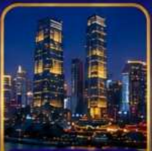
ตึกไควซิงไห่