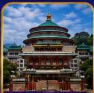
มหาศาลาประชาชนฉงชิ่ง