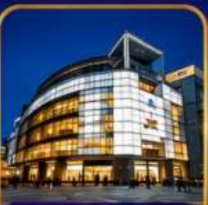
The Ring Mall