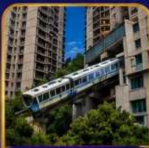
สถานีรถไฟฟ้ายักษ์