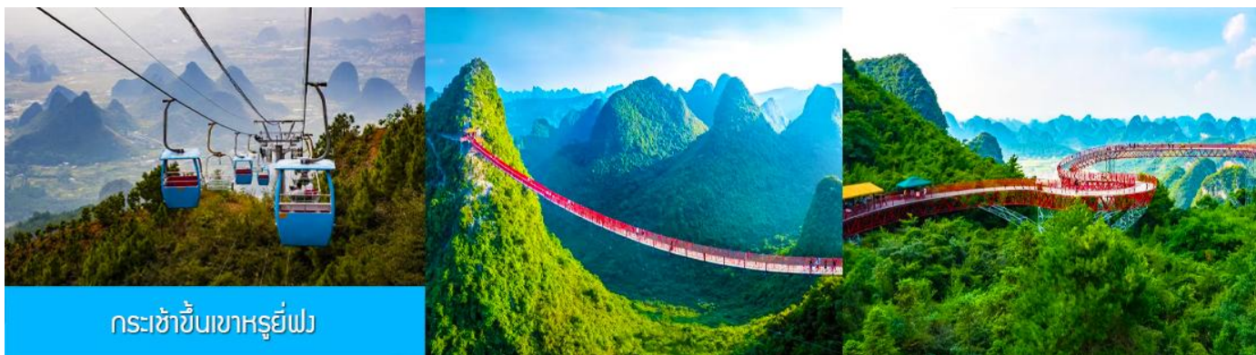
กระเช้าขึ้นเขาหฺรูยี่ฟง

ไกด์นำเสนอบนขบวนโปรแกรมเสริม OPTIONAL TOUR แพคเกจท่องเที่ยวภูเขาหฺรูยี่ฟง นำท่านนั่งกระเช้าขึ้นสู่ ภูเขาหฺรูยี่ฟง 如意峰 (แปลเป็นไทยคือเขาสมหวัง) เพื่อเที่ยวชมความงามแบบสุดอลังการของภูเขาหฺรูยี่ฟง หรือเขาอวตารแห่งเมืองกุ้ยหลิน ภูเขาที่ตั้งอยู่ในเมืองหยางชัว เป็นแหล่งท่องเที่ยวใหม่ที่ได้รับความนิยมอย่างมากจากนักท่องเที่ยว ท่านสามารถนั่งกระเช้าขึ้นสู่ยอดเขาหฺรูยี่ฟง เมื่อขึ้นถึงจุดชมวิวยอดเขาแล้ว ท่านจะได้สัมผัสทัศนียภาพแบบ Panorama ของขุนเขาหินปูนน้อยใหญ่กว่าพันลูกที่ตั้งเรียงรายอยู่โดยรอบ กินพื้นที่หลายพันไร่ ท่านสามารถเดินข้ามสะพานเชือกข้ามหุบเขาที่เป็นจุดถ่ายภาพสำคัญ เดินทางสะพานพื้นกระจกสุดหวาดเสียวเพราะถูกสร้างขึ้นบนยอดเขา และลานชมวิวดำเนินภาพรอบด้านแบบ Panorama บนยอดเขาที่ปูด้วยพื้นกระจก ที่นี้จึงถือเป็นจุดท่องเที่ยวไฮไลท์ของเมืองหยางชัวที่นักท่องเที่ยวต้องมาเยือน.....อัตราค่าบริการ ท่านละ 400 หยวน หรือ 2,000 บาท ใช้เวลาในการท่องเที่ยวประมาณ 3 – 4 ชั่วโมง (ขึ้นอยู่กับจำนวนนักท่องเที่ยวในแต่ละวัน) ค่าบริการรวม ค่าบัตรเข้าอุทยาน ค่ากระเช้า ค่ารถรับ ส่ง และค่าน้ำดื่มของไกด์ท้องถิ่น