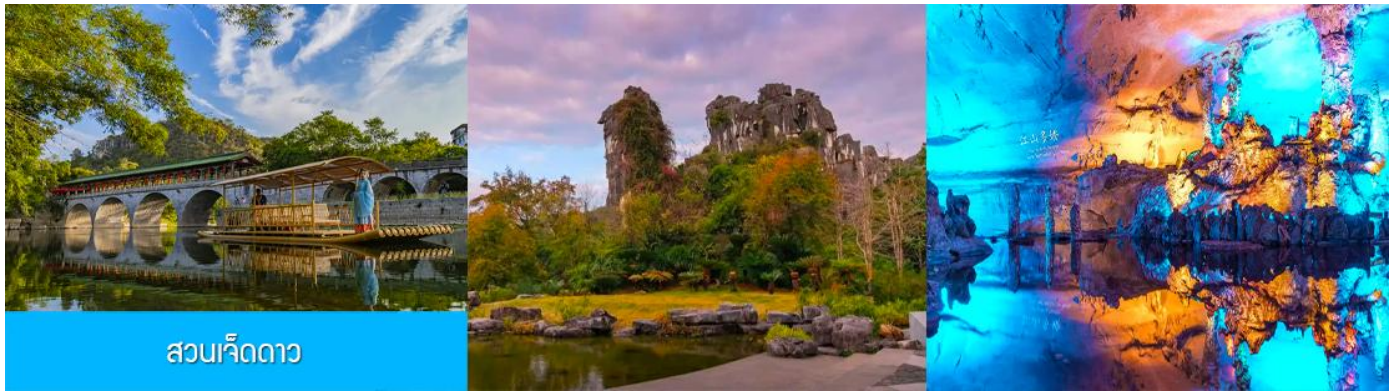
สวนเจ็ดดาว

หลังอาหารนำท่านเที่ยวชม สวนเจ็ดดาว 七星公园 (รวมค่าตั๋วเข้าชมและค่ารถอล์ฟแล้ว) เป็นสาธารณะที่ใหญ่ที่สุดและสวยงามที่สุดในเมืองกุ้ยหลิน ตั้งอยู่ทางด้านตะวันออกของแม่น้ำหลีเจียงมีชื่อเสียงในเรื่อง ภูเขาเขียว น้ำสวย ถ้ำแปลก และหินงาม ภายในอุทยานมีอาณาเขตครอบคลุมพื้นที่เนินเขา 7 ลูก ที่เรียงกันเหมือนกลุ่มดาวหมีใหญ่ ภายในมีสถาปัตยกรรมจีน โบราณตั้งเรียงรายและพืชพันธุ์มากมายในท่านได้เพลินเพลิดเพลินกับหุบเขาอันเงียบสงบ ชมความสวยงามของ ถ้ำเจ็ดดาว 七星岩 ที่ภายในเต็มไปด้วยหินงอกหินย้อยและเสาหินที่เกิดจากการหลอมละลายของหินปูน ชม เขาอูฐ 骆驼山 ภูเขารูปร่างคล้ายหลังอูฐนี้เกิดจากการดันตัวของเปลือกโลก เดิมเรียกว่าเขาจอกสุรา แต่เดิมในอดีตนั้นสถานที่แห่งนี้เคยเป็นที่ปลีกวิเวกของเหล่านักปราชญ์แล้วเขาอูฐนี้ก็ได้อกลายเป็น สัญลักษณ์ทางภูมิทัศน์ของกุ้ยหลินอีกด้วย