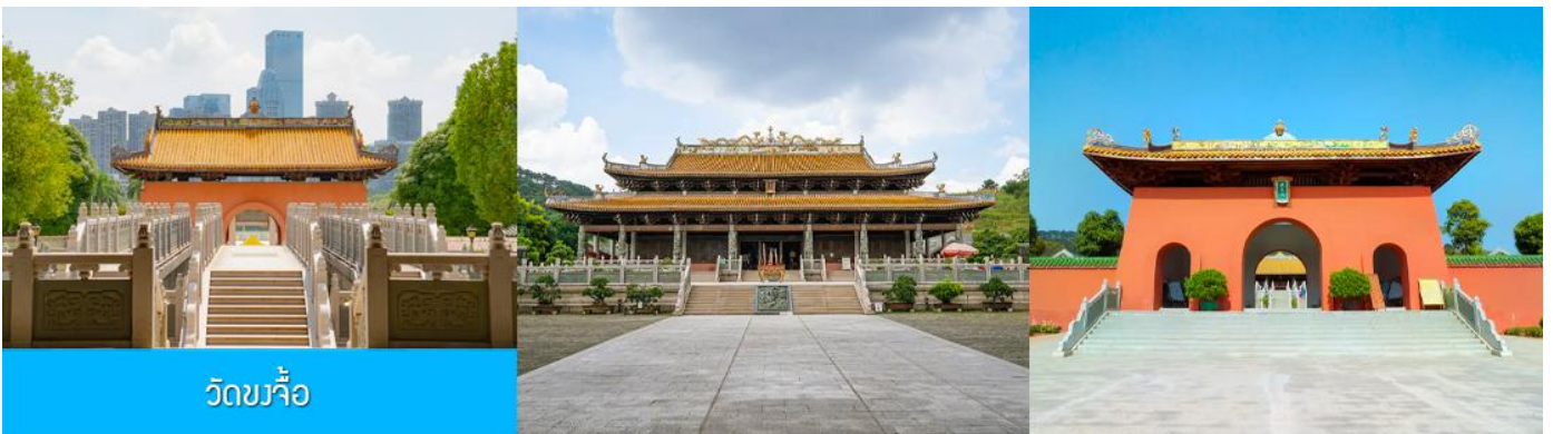
วัดขงจื้อ

เช้า บริการอาหารเช้า ณ ร้านอาหารในโรงแรม (8)