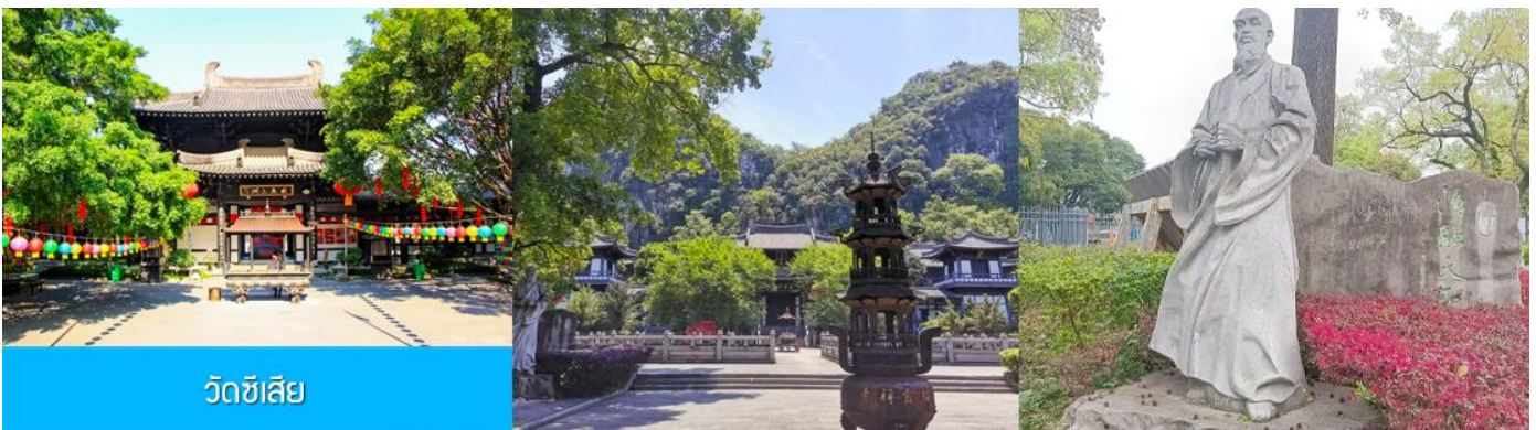
วัดซีเสี

หลังอาหารนำท่านเที่ยวชม สวนเจ็ดดาว 七星公园 (รวมค่าตั๋วเข้าชมและค่ารถอล์ฟแล้ว) เป็นสาธารณะที่ใหญ่ที่สุดและสวยงามที่สุดในเมืองกุ้ยหลิน ตั้งอยู่ทางด้านตะวันออกของแม่น้ำหลีเจียงมีชื่อเสียงในเรื่อง ภูเขาเขียว น้ำสวย ถ้ำแปลก และหินงาม ภายในอุทยานมีอาณาเขตครอบคลุมพื้นที่เนินเขา 7 ลูก ที่เรียงกันเหมือนกลุ่มดาวหมีใหญ่ ภายในมีสถาปัตยกรรมจีน โบราณตั้งเรียงรายและพืชพันธุ์มากมายในท่านได้เพลินเพลิดเพลินกับหุบเขาอันเงียบสงบ ชมความสวยงามของ ถ้ำเจ็ดดาว 七星岩 ที่ภายในเต็มไปด้วยหินงอกหินย้อยและเสาหินที่เกิดจากการหลอมละลายของหินปูน ชม เขาอูฐ 骆驼山 ภูเขารูปร่างคล้ายหลังอูฐนี้เกิดจากการดันตัวของเปลือกโลก เดิมเรียกว่าเขาจอกสุรา แต่เดิมในอดีตนั้นสถานที่แห่งนี้เคยเป็นที่ปลีกวิเวกของเหล่านักปราชญ์แล้วเขาอูฐนี้ก็ได้อกลายเป็น สัญลักษณ์ทางภูมิทัศน์ของกุ้ยหลินอีกด้วย