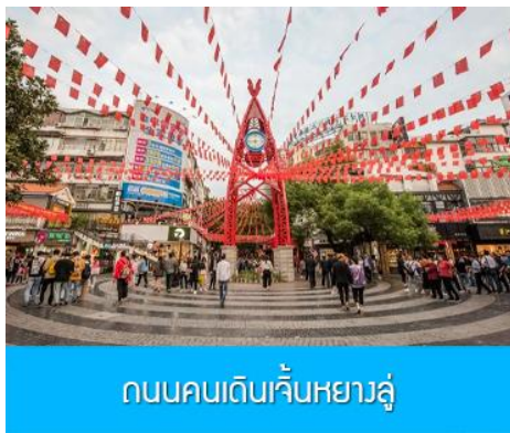
ถนนคนเดินจิ้นหยางลู่