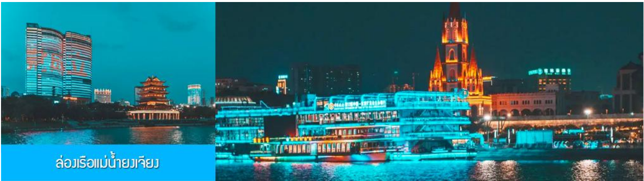
ล่องเรือแม่น้ำยวเจียง

ไกด์ท้องถิ่นนำเสนอ โปรแกรมทัวร์เสริม OPTIONAL TOUR ล่องเรือแม่น้ำยวเจียงชมแสงสียามค่ำของเมืองหนานหนิง..... อัตราค่าบริการสำหรับโปรแกรมเสริมเมืองลับแล ท่านละ 250 หยวน ใช้เวลาประมาณ 1 ชั่วโมงครึ่ง ค่าบริการรวม ค่าบัตรเข้าชม ค่ารถรับ ส่ง และค่าน้ำเที่ยวของไกด์ท้องถิ่น