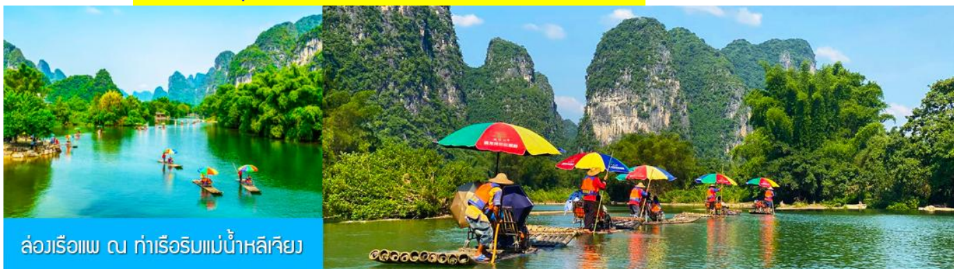
ล่องเรือแพ ณ ท่าเรือริมแม่น้ำหลีเจียง

ไกด์นำเสนอบนขบวนโปรแกรมเสริม OPTIONAL TOUR แพคเกจท่องเที่ยวภูเขาหฺรูยี่ฟง นำท่านนั่งกระเช้าขึ้นสู่ ภูเขาหฺรูยี่ฟง 如意峰 (แปลเป็นไทยคือเขาสมหวัง) เพื่อเที่ยวชมความงามแบบสุดอลังการของภูเขาหฺรูยี่ฟง หรือเขาอวตารแห่งเมืองกุ้ยหลิน ภูเขาที่ตั้งอยู่ในเมืองหยางชัว เป็นแหล่งท่องเที่ยวใหม่ที่ได้รับความนิยมอย่างมากจากนักท่องเที่ยว ท่านสามารถนั่งกระเช้าขึ้นสู่ยอดเขาหฺรูยี่ฟง เมื่อขึ้นถึงจุดชมวิวยอดเขาแล้ว ท่านจะได้สัมผัสทัศนียภาพแบบ Panorama ของขุนเขาหินปูนน้อยใหญ่กว่าพันลูกที่ตั้งเรียงรายอยู่โดยรอบ กินพื้นที่หลายพันไร่ ท่านสามารถเดินข้ามสะพานเชือกข้ามหุบเขาที่เป็นจุดถ่ายภาพสำคัญ เดินทางสะพานพื้นกระจกสุดหวาดเสียวเพราะถูกสร้างขึ้นบนยอดเขา และลานชมวิวดำเนินภาพรอบด้านแบบ Panorama บนยอดเขาที่ปูด้วยพื้นกระจก ที่นี้จึงถือเป็นจุดท่องเที่ยวไฮไลท์ของเมืองหยางชัวที่นักท่องเที่ยวต้องมาเยือน.....อัตราค่าบริการ ท่านละ 400 หยวน หรือ 2,000 บาท ใช้เวลาในการท่องเที่ยวประมาณ 3 – 4 ชั่วโมง (ขึ้นอยู่กับจำนวนนักท่องเที่ยวในแต่ละวัน) ค่าบริการรวม ค่าบัตรเข้าอุทยาน ค่ากระเช้า ค่ารถรับ ส่ง และค่าน้ำดื่มของไกด์ท้องถิ่น