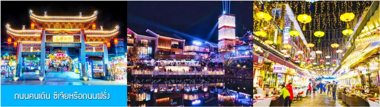
ถนนคนเดิน ซิเจียหรือถนนฝรั่ง