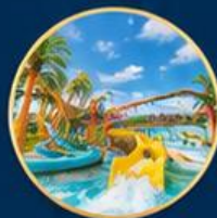
สวนน้ำไต้ฝุ่น Typhoon World