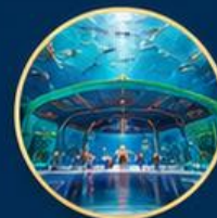
โลกใต้ท้องทะเล The Sea Shell