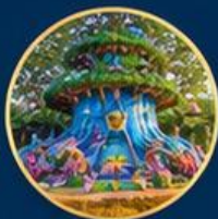
โลกแฟนตาซี Fantasy World