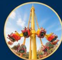
โลกการผจญภัย Adventure World