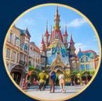
ถนนยุโรป European Streetmosphere