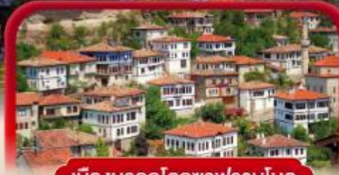
เมืองมรดกโลกซาฟรานโบลู