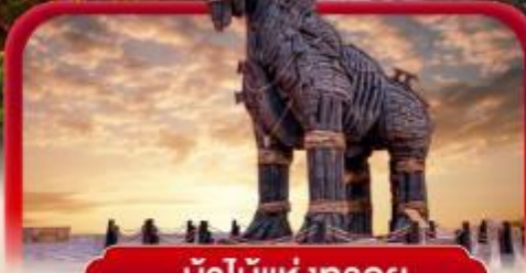
ม้าไม้แห่งทรอย