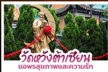
วัดหวังต้าเซียน ขอพรสุขภาพและความรัก

ขอพรเจ้าแม่กวนอิมวัดซีซ่าน ที่สูงเป็นอันดับ 2 ของโลก นั่งกระเช้าเองปีงสักการะพระใหญ่เทียนถาน • ขอพรองค์แซง โชคลาก การเงินและธุรกิจ • ซ็อบปีงจู่ใจย่านจิมซาจุ่ย และ CITYGATE OUTLETS