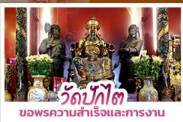
วัดบักกิต ขอพรความสำเร็จและการทำงาน