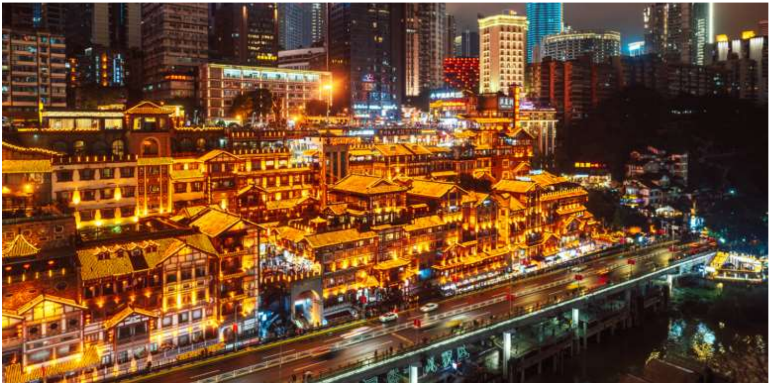
เย็น บริการอาหารเย็น ณ ภัตตาคาร เมนูพิเศษ: บุฟเฟ่ต์หม้อไฟฉงชิ่ง

จากนั้นเดินทางไปยัง ตลาดหงหยาดัง (Hongyadong) หรือที่เรียกว่า "Hongya Cave" เป็นสถานที่ท่องเที่ยวที่มีชื่อเสียงในเมืองฉงชิ่ง โดยตั้งอยู่ริมแม่น้ำแยงซี มีบรรยากาศที่เต็มไปด้วยวัฒนธรรมและประวัติศาสตร์ ตลาดหงหยาดังเป็นพื้นที่ที่มีอาคารแบบดั้งเดิมที่สร้างขึ้นในสไตล์สถาปัตยกรรมแบบชิโน-ทิเบต โดยมีร้านค้า ร้านอาหาร และบาร์จำนวนมาก ที่นี่คุณสามารถลิ้มลองอาหารท้องถิ่นที่อร่อย เช่น ฮอทพอทฉงชิ่ง (Chongqing Hot Pot) และขนมพื้นเมืองอื่นๆ นอกจากนี้ ตลาดหงหยาดังยังมีวิวทิวทัศน์ที่สวยงาม โดยเฉพาะในช่วงเย็นเมื่อไฟประดับส่องสว่าง ที่ทำให้บรรยากาศมีความโรแมนติกและน่าตื่นตาตื่นใจ คุณสามารถเดินเล่นตามทางเดินที่มีการจัดแสดงงานศิลปะและสินค้าท้องถิ่น