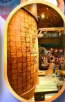
ร้านสตาร์บักส์