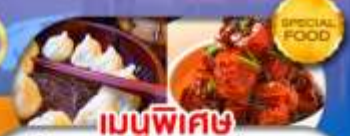
เมนูพิเศษ เสี่ยวหลงเปา หมูน้ำแดง เดินทาง ต.ค. 69 - มี.ค. 70