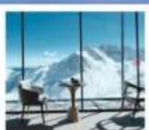
4860 COFFEE SHOP