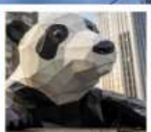
ห้าง IFS หมีแพนด้าเป็นตึก