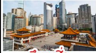
ตึกขุยซิง

พระแกะสลักหินต้าจู้ - หลุมฟ้าสะพานสวรรค์ - เขานางฟ้า ตึกขุยซิง - ตึกตะเกียบ หมู่บ้านโบราณฉือซีไห่