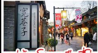
หมู่บ้านโบราณฉือซีไห่