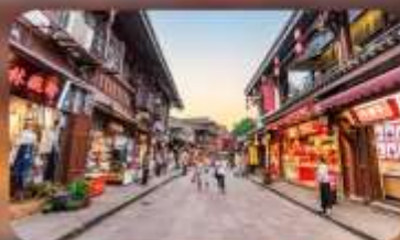
หมู่บ้านโบราณฉือซีไห่