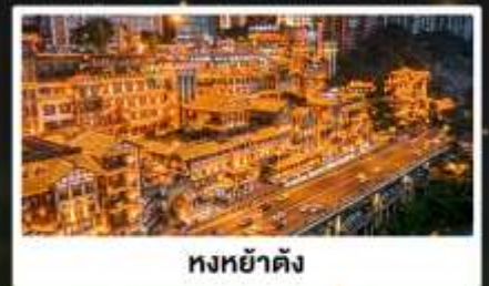
หงหย่าต้ง