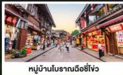
หมู่บ้านโบราณฉีซีโจว