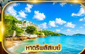
หาดริพลัสเบย์