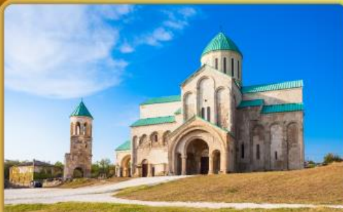
มหาวิหารบากราติ