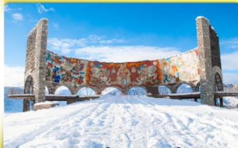
อนุสรณ์สถานรัสเซีย