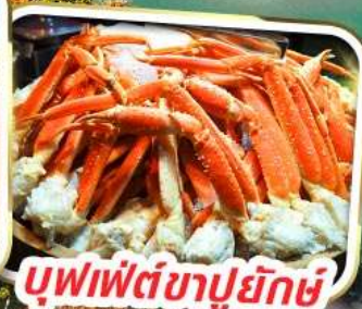
บุฟเฟ่ต์ซาปูยักษ์