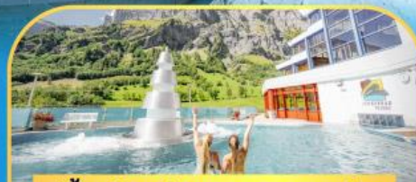
แช่น้ำแร่ร้อนผ่อนคลายลวยคอร์บัต