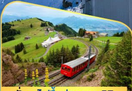
นั่งรถไฟขึ้นสู่ยอดเขาโรติก