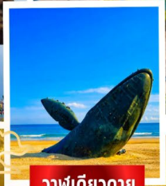
วาฬเดี่ยวดาย