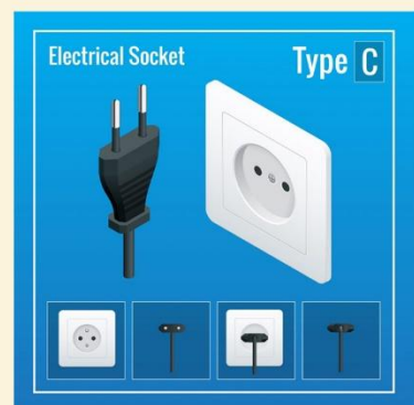
ปลั๊กไฟที่ใช้ที่อียิปต์