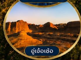
อู่เจ้อเซ่อ