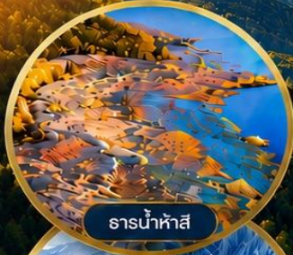
ธารน้ำห้ำสี่