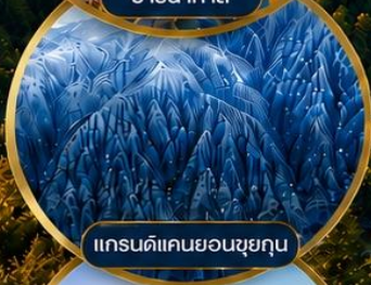
แกรนด์แคนยอนซุยกุณ