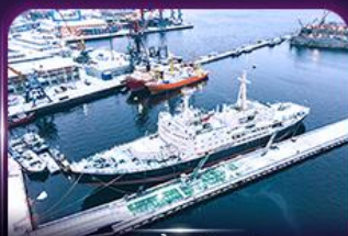
เรือตัดน้ำแข็งเลนิน