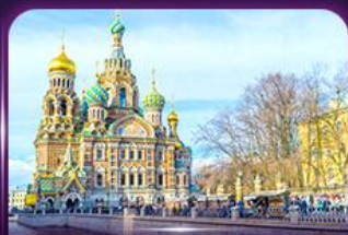
โบสถ์แห่งหยดเลือด