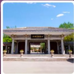
อุทยานประวัติศาสตร์จี้จวอน