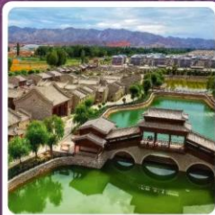
หมู่บ้านตันเซี่ยโซ่ว