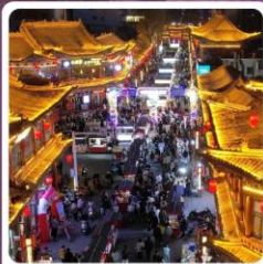
ตลาดจางเย่