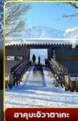
ฮาคุบะอิวาตาคะ