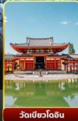
วัดเมียวโอดิน