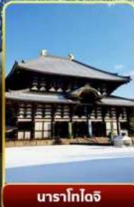
นาราโกโตจิ

พิเศษพักในเมืองคุสัทสึออนเซ็นพร้อมชมยูบาคาเกะ