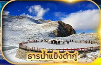
ธารน้ำแข็งต่ากู่