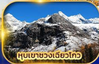
หุบเขาขวงเฉียวโกว