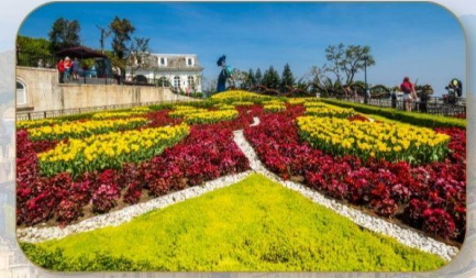
สวนดอกไม้ Le Jardin D'Amour