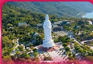
องค์กวนอิม วัดหลันอิ่ง