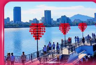
สะพานแห่งความรัก