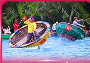
ส่องเรือกระดัง หมู่บ้านกิมทาน