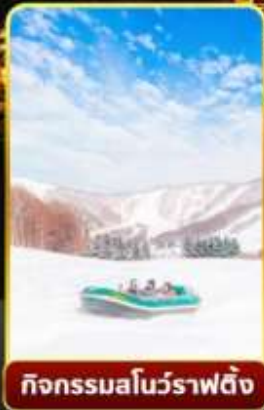
กิจกรรมโนว์ราฟติง