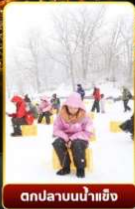
ตกปลาน้ำแข็ง