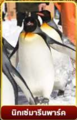
บิกชามารีนพาร์ค