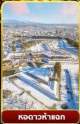
หอดาวห้าแฉก

🌊 ออนเซ็น 3 คั้น 🧳 มน.กระเป๋า 1 ใบ 23 กก 🌞 7Days 5Night