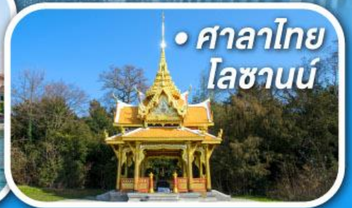
• ศาลาไทย โลซานน์

• สุดอากาศดีที่เซอร์แมท • ขึ้นกระเช้าสู่ยอดจากลาเซียร์ 3000 • ชมเมืองคลาสสิกเบิร์น ลูเซิร์น ซูริก