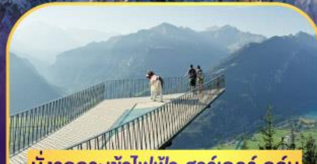
นั่งรถกระเช้าไฟฟ้า ชาร์เตอร์ ดูล์ม