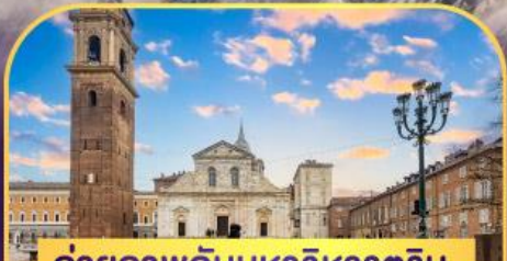
ถ่ายภาพกับมหาวิหารคูริน