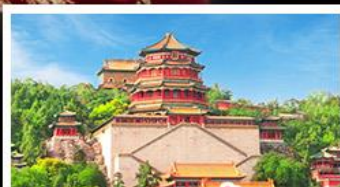
พระราชวังฤดูร้อนอี่เหอหยวน