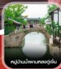
หมู่บ้านน้ำผานหลงกู่เจิน