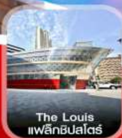
The Louis แฟล็กชิปไฮเต็ล

✈ คอนเฟิร์มออกเดินทาง ทุกพีเรียด 2 ท่านขึ้นไป