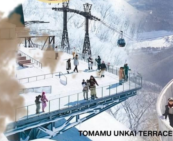
TOMAMU UNKAI TERRACE