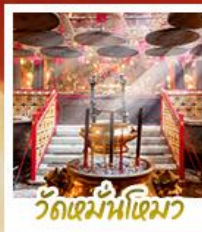
วัดหมื่นโหมว