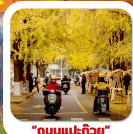
"ถนนแปะก๊วย"

นั่งกระเช้าชมภูเขาหวงอู่ซาน ขุนเขาใบไม้แดงอันดับหนึ่งของประเทศจีน เมืองชู่หยหนิง วัดหลิงจวน (วัดเจ้าแม่กวนอิมกะพริบตา) - พาสินแกะสลักต้าจู้ หงหยาดัง ถนนแปะก๊วย ตึกตะเกียบ วัดหลัวซัน ล่องเรือชมวิวฉงชิ่ง