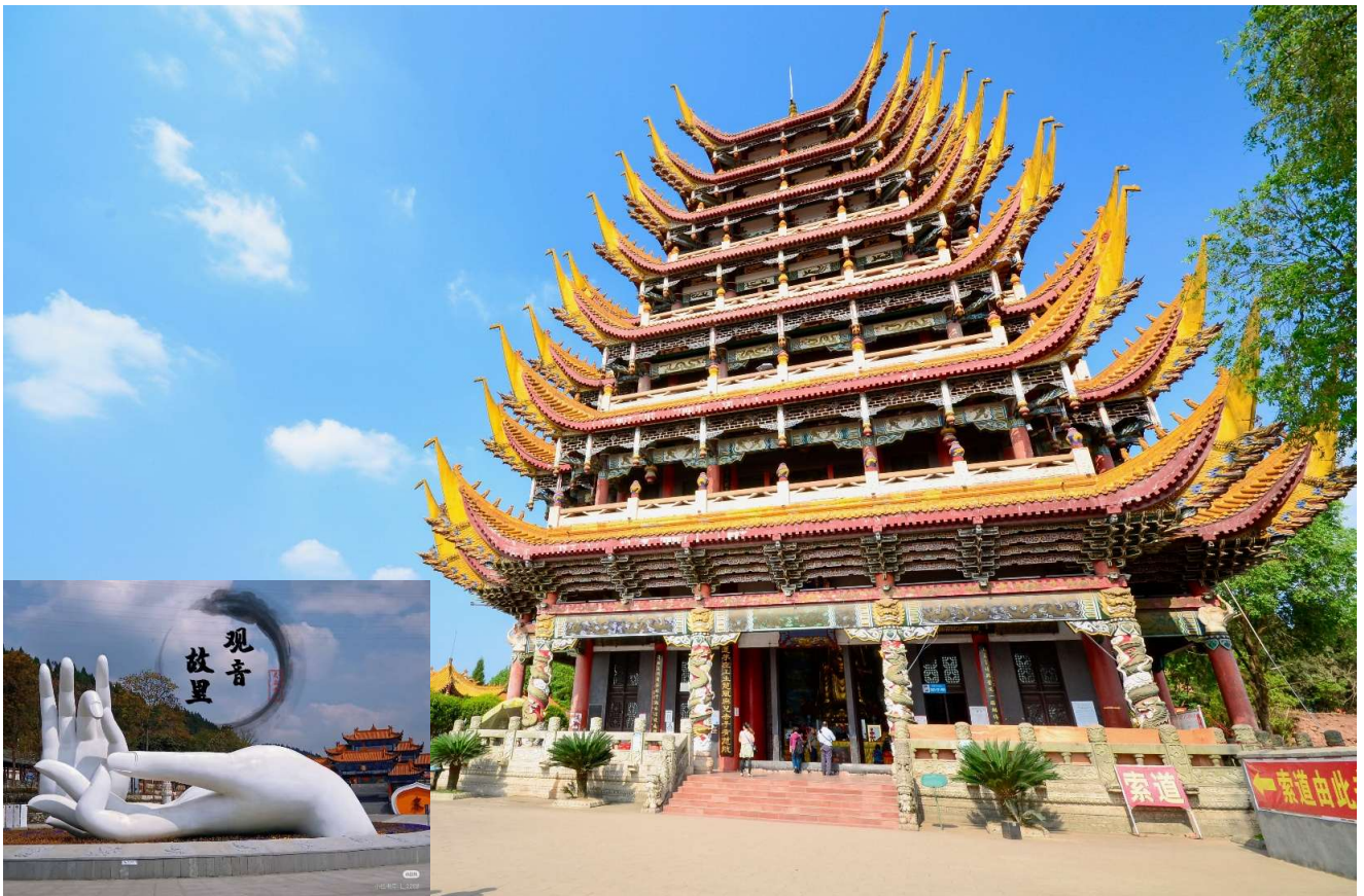
T2G-CKG36FD ฉงชิ่ง กวางตุ้งซาน...วัดหลิงฉวน ต้าจู้ ชมถนนแปะก๊วย 5D 4N (FD)

จากนั้นนำท่านเดินทางสู่ วัดหลิงฉวน (Lingquan Temple) หรือ วัดเจ้าแม่กวนอิมกระพริบตา เป็นวัดเก่าแก่ซึ่งสร้างขึ้นในปลายราชวงศ์สุย (ค.ศ. 581 - 618) และบูรณะพัฒนาต่อเนื่องมา มีความเชื่อว่าเป็นวัดที่มีความศักดิ์สิทธิ์อย่างมาก มีเรื่องเล่ากันว่า เมื่อครั้งเกิดแผ่นดินไหวที่มณฑลเสฉวน ชาวบ้านที่มาสักการะเห็นเจ้าแม่องค์นี้ได้กระพริบตาและหลั่งน้ำตา เสมือนท่านสงสารชาวผู้ประสบภัย ภายในวัดแห่งนี้ยังได้แสดงประวัติของเจ้าแม่กวนอิม วิหารเจ้าแม่กวนอิม ภายในวิหารเจ้าแม่กวนอิม มีองค์เจ้าแม่กวนอิมยืนสูง 18.6 เมตร