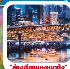
"ล่องเรือชมหงหยาดัง"