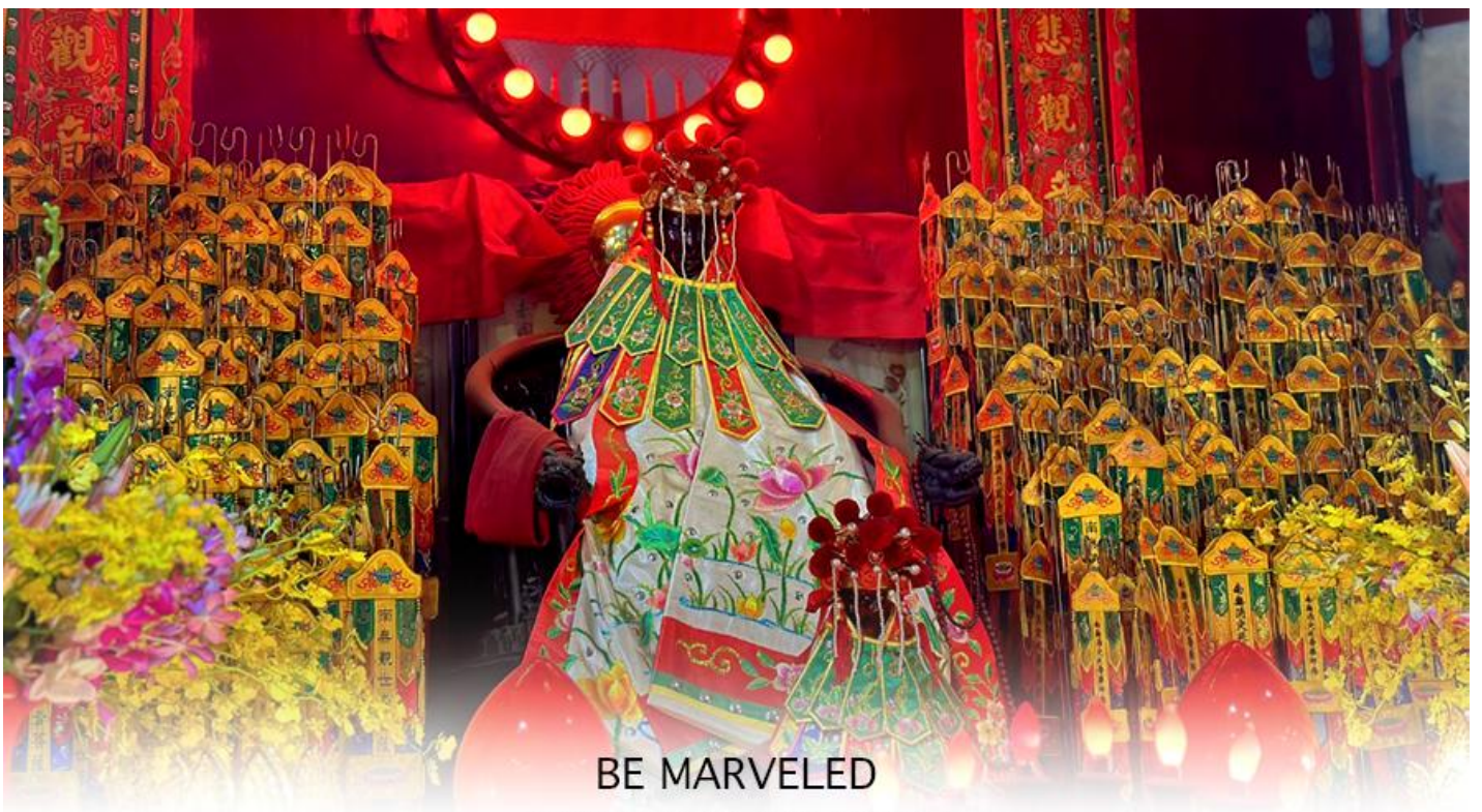
BE MARVELED วัดเจ้าแม่กวนอิมฮวงอ้า (ยิมฮิน)

ให้เดินทางกลับไปกราบไหว้ และขอบคุณเจ้าแม่กวนอิมอีกครั้ง โดยเตรียมชุดไหว้และกระดวยเงินกระดวยทองที่เป็นเหมือนเงินที่เรานำมาคืน เป็นการไหว้เพื่อคืนเงินเจ้าแม่กวนอิมนั่นเอง