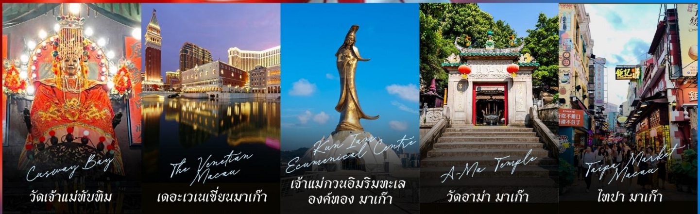
Casway Bay วัดเจ้าแม่ทับทิม

รายการทัวร์ข้างต้นอาจมีการปรับเปลี่ยนเพื่อความเหมาะสม