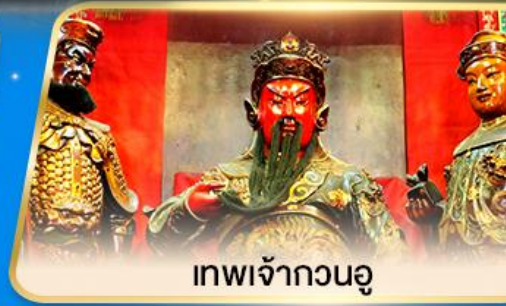
เทพเจ้ากวนอู