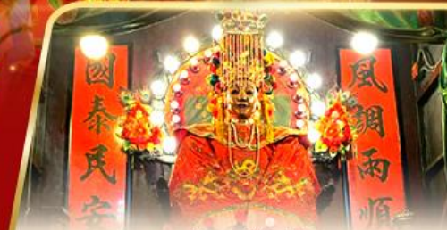
เจ้าแม่ทับทิม