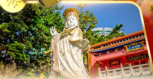
เจ้าแม่กวนอิม ธิพลสมัย