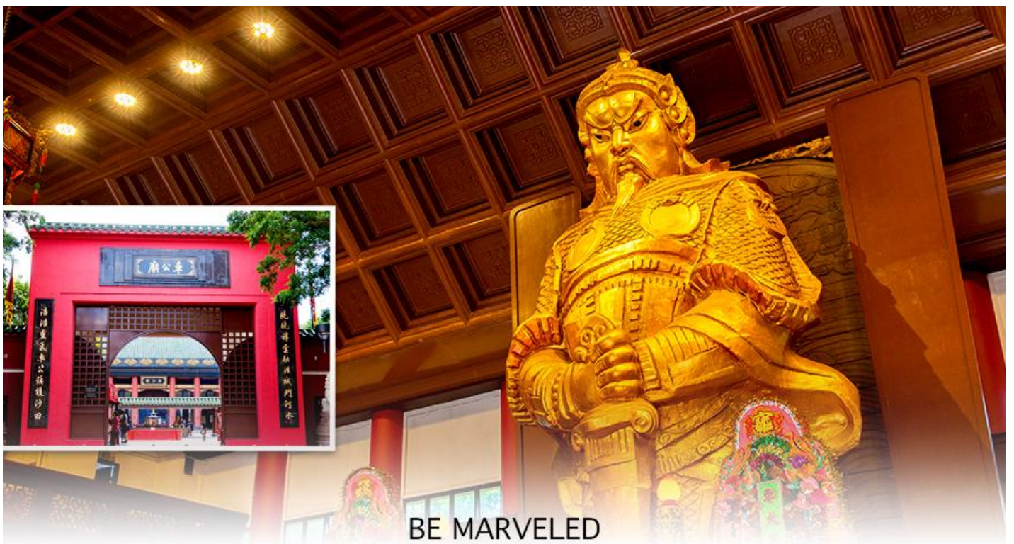
BE MARVELED วัดเขangkง

นำท่านเดินทางสู่ วัดเขangkงหมิว หรืออีกชื่อหนึ่งว่า “วัดกั๊งหันลม” หนึ่งในวัดดังของฮ่องกง ที่ประชาชนให้ความเลื่อมใสศรัทธามานาน ด้านในศาลจะมีรูปปั้นสูงใหญ่ของท่านเขangkง ซึ่งเป็นเทพประจำวัดแห่งนี้ เชื่อ ว่าองค์ท่านศักดิ์สิทธิ์ในการขอพรด้านโชคลาภ เสริมความเป็นสิริมงคล ปิดเป่าเรื่องร้ายๆออกไป และวัดแห่งนี้ยังเป็นสถานที่ที่นิยมสำหรับท่านที่ต้องการแก้ปีชงอีกด้วย โดยวิธีการไหว้ขอพรจากท่านเขangkงนั้น ท่านจะต้องเข้าไปยืนอยู่เบื้อง หน้ารูปปั้นของท่าน แล้วอธิษฐานขอพรพร้อมกับมองหน้าท่านอย่างมุ่งมั่นตั้งใจ จากนั้นให้ท่านทำพิธีหมุน “กั๊งหันแห่ง โชคชะตา” หรือ "กั๊งหันนำโชค" เพื่อหมุนรับแต่สิ่งดีๆ ให้เข้ามาในชีวิต