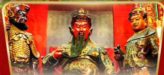
เทพเจ้ากวนอู