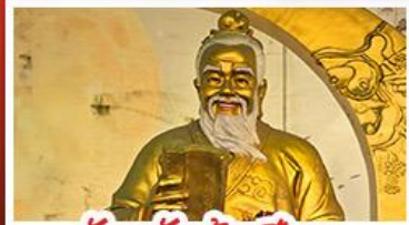
วัดเข่งต้าเซียน

วัดเจ้าแม่กวนอิมฮ่องกง - กระเช้ามองปิง พระใหญ่โป้วหลิน - เจ้าแม่กวนอิมรัฟส์เบย์ วัดแชกงหมิว - วัดหวังต้าเซียน - วัดเจ้าแม่ทับทิม