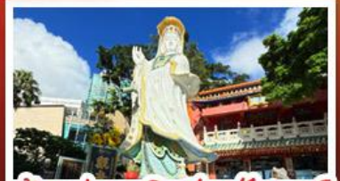
เจ้าแม่กวนอิมรัฟส์เบย์