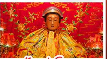
วัดเล่งจื๊อเมว