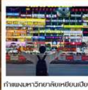
กำแพงมหาวิทยาลัยเหยียนเปียน