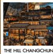
THE HILL CHANGCHUN