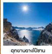
อุทยานดางโป่ซาน