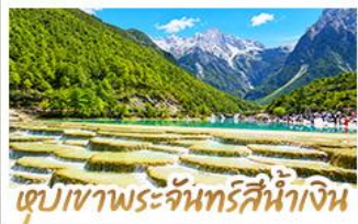
เขุบเขาพระจันทร์สีน้ำเงิน