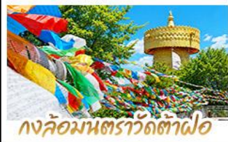
วงล้อมมนตราวัดต้าฟอ

ถ่ายรูป MOOD ที่ใช้กับวิวทะเลสาบเอ๋อร์ไห่สุดโรแมนติก • ชมดอกไม้ตามฤดูกาลกลางขุนเขา ณ สวนอวายุ่าง พิศดารที่มโหฬารความสูงกว่า 4,506 เมตร (รวมกระเช้าใหญ่ไป-กลับ) • นั่งรถไฟชมวิวภูเขาหิมะมังกรหยก ชนวิญแบบพาโนรามา • เที่ยวเมืองโบราณต้าหลี่ ลี้เจียง แซงกรี่ล่า ซิม ซ็อง ทะวะ กับวัฒนธรรมยูนนานกับเบต ชมธารน้ำขาวไปสู้อยู่ไกล UNSEEN เมืองจันทองยูนนาน • วัดลามะซงจ้านหลิน สัมผัสกลิ่นอายอารยธรรมทิเบต VOPPSกับวงล้อมตราที่ใหญ่ที่สุดในโลก • ซ็องปิงเฟลิม ณ ถนนคนเดินหนานมิงเจียง & POP MART