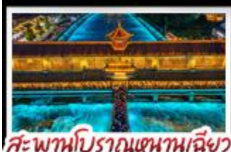
สะพานโบราณหนานชิว

อุทยานต้ากู่ปิงชว่น - อุทยานสี่ดรุณี - หมี่แพนด้าเซลฟี่ ป่าฟิมิน่าตึกSKP - อุทยานปี้เฉิงโกว - สะพานโบราณหนานชิว สตรีทอาร์ต Eastern Suburb Memory - เมืองโบราณลั่วตี้ เบมูพิศข ม้าอโฟพมาล่า