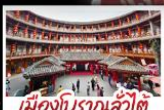
เมืองโบราณลั่วตี้