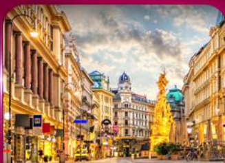
ชมเมืองโรมเนติก เวียนนา