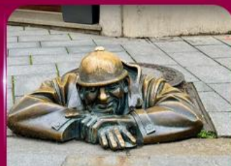
เซลฟี่คู่คูมิลา บราติสลาวา