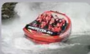
สนุกกับเรือ Shotover Jet