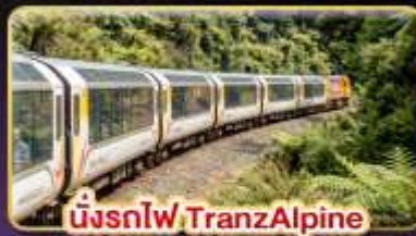
นั่งรถไฟ TranzAlpine