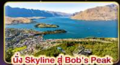
นั่ง Skyline ที่ Bob's Peak