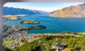
นั่ง Skyline สู่ Bob's Peak