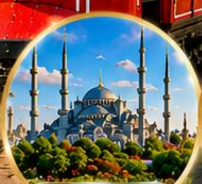
สุเหร่าสีน้ำเงิน Blue Mosque