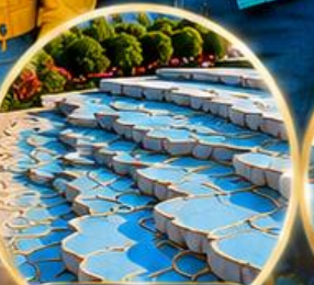
ปามุกคาล์ Pamukkale