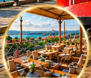
Seven Hills Cafe ชมวิว อิสตันบูล