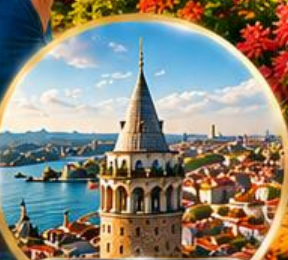
หอคอยกาลาตา Galata Tower