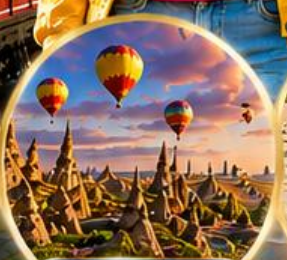
เมืองคปปาโดเกีย Cappadocia