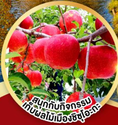
สนุกกับกิจกรรม เก็บผลไม้เมืองชิซุโอะกะ