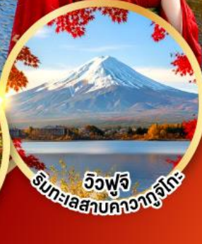
วิวฟูจิ ริมทะเลสาบคาวากูจิโกะ