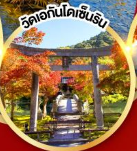
วัดเอกินโตเซ็นริน