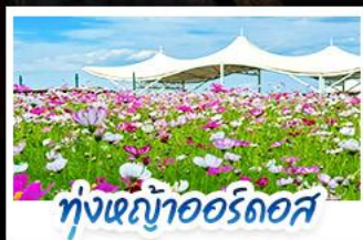
ทุ่งหญ้าแอร์ดอส