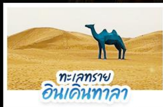
ทะเลทราย อินเคินทาลา