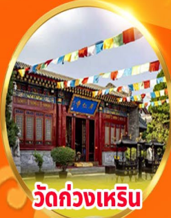
วัดกวางเหริน