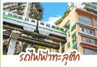
รถไฟฟ้าทะเลสาบสี่จ้อป้า

ชมธรรมชาติ ณ อุ๋หลง ชมหุบเขาสุดอลังการระดับมรดกโลก นั่งรถไฟฟ้าทะเลสาบสี่จ้อป้า สัญลักษณ์เมืองฉงชิ่งสุดล้ำ สัมผัสวิถีภูเขาหิมะแห่ง ภูเขาสี่ดรุณี งดงามจนได้รับฉายา "เทือกเขาแอลป์แห่งตะวันออก" ชมธรรมชาติสุดฟิน ณ อุทยานปี่ฝิ่งโกว • ช้อปปิ้งจุใจ ถนนคนเดินไท่กู่หลี่, ถนนคนเดินซุนซู่