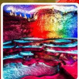
ถ้ำเก้าเทพ

ไฮไลท์! หมู่บ้านชาวน้ำเสียวเหอจินเจีย หมู่บ้านโบราณฝูหรงเจิ้น ถ้ำเก้าเทพ ล่องเรือทะเลสาบผิงหู สวนถ้ำสามสหาย