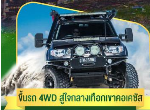
คันรถ 4WD สู้อีกกลางเทือกเขาคอเคซัส