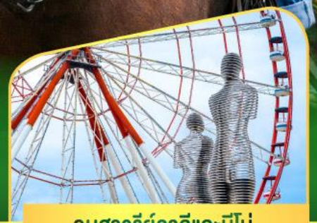
อนุสาวรีย์อาลีและนีโน่